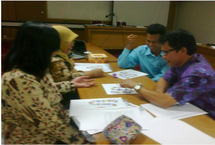
Praktik pembuatan media pembelajaran bahasa Jerman.