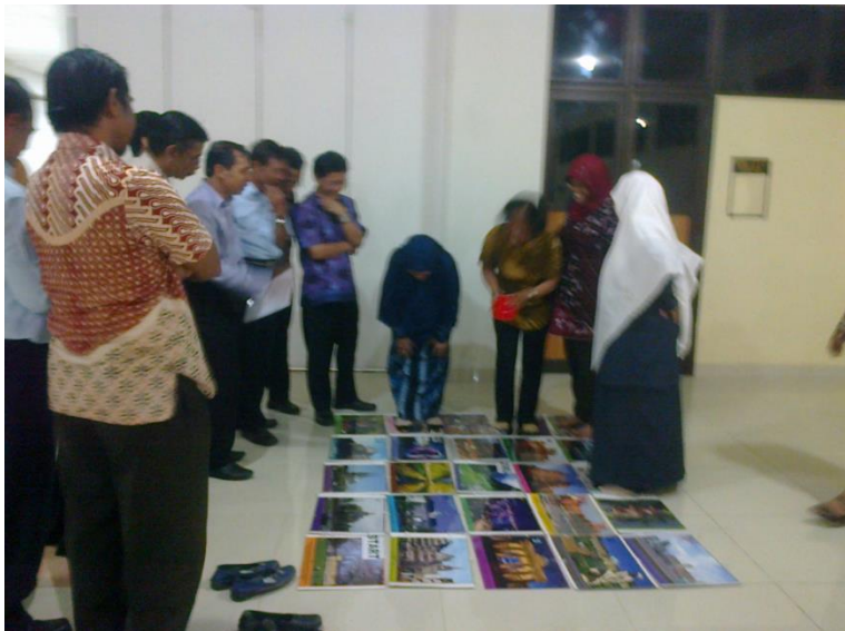
Praktik pemanfaatan media pembelajaran bahasa Jerman.