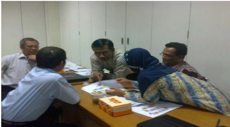
Peserta tampak antusias mengikuti praktik pembuatan media pembelajaran bahasa Jerman.