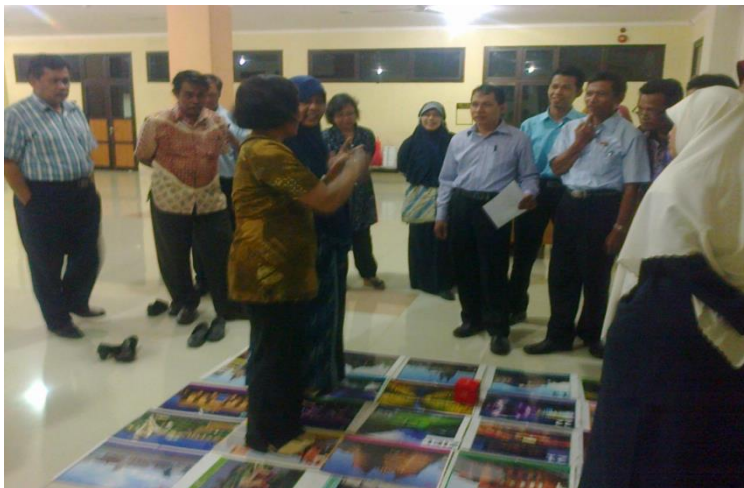
Praktik pemanfaatan media permainan bahasa Jerman.