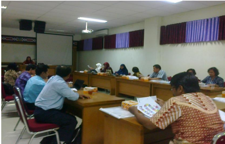
Peserta pelatihan pemanfaatan media pembelajaran dalam pembelajaran bahasa Jerman.